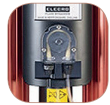
Bomba dosificadora Bomba dosadora