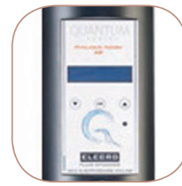
Panel de control Painel de controle