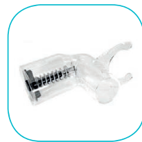
Vacuómetro Medidor de vacío