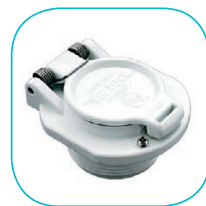
Vac Lock Vac Lock