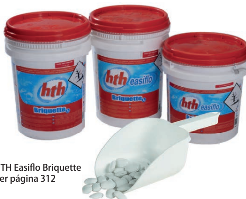
HTH Easiflo Briquette Ver página 312