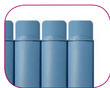
ACABADO RECTO ACABAMENTO RETO