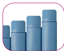
ACABADO EN ESCUADRA ACABAMENTO EN ESQUADRA