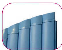
ACABADO EN FORMA ACABAMENTO EM FORMA