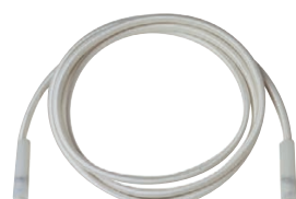
Goma / Borracha 1,50 m 2 cabiclics