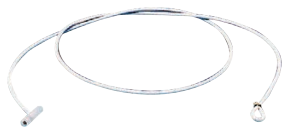
Goma / Borracha 1,50 m